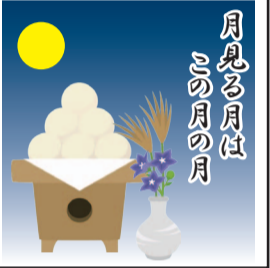
※百人一首 一部抜粋