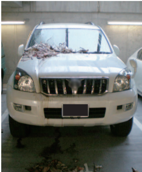
車に撒かれた生ゴミ。写真からも臭いが漂ってきそうな、ひどい状況。異臭が駐車場一面に広がっていました。