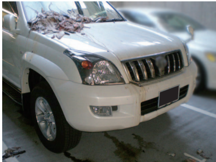
生ゴミの雑液が地面に染み込んでいます。

当社の商品は臭いを消すのは通過点であり、原状回復まで持つて行き維持することが出来ます。